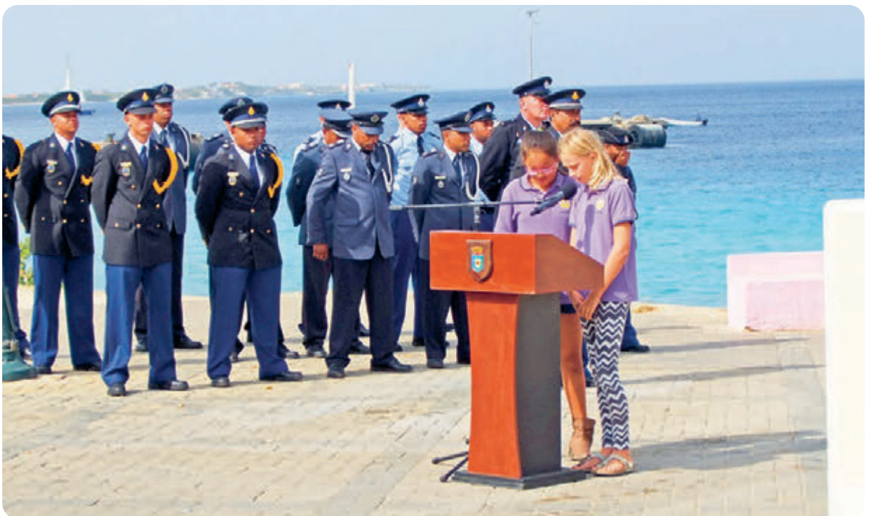
Alumnonan di Pelikaanschool ta declama un poema durante e conmemoracion na Boneiro.

Por scoge pa organisa un propio conmemoracion na un monumento di guerra of den scol caminda alumnonan di bo klas ta organisa delaster un cos, di saca invitacion te na hinca e programa den otro. Tambe por join e organizacion Conmemoracion 4 di mei local y duna e alumnonan un tarea.