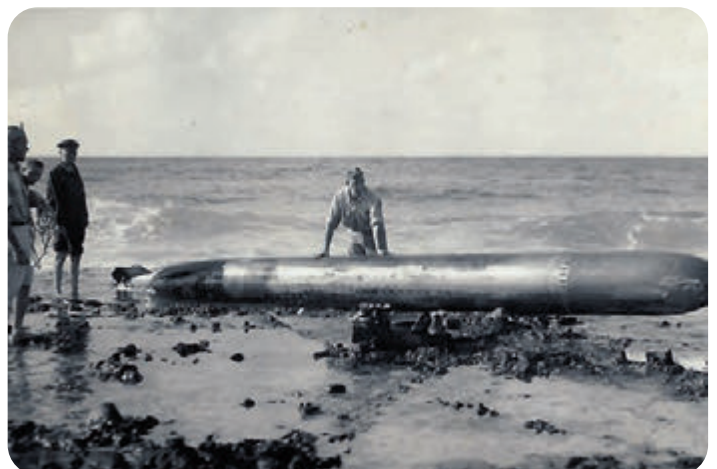
Un torpedo cu no a explota riba beach di Corsou.

Ta prepara habitantenan di e islanan pa atakenan aereo, aunke ta mas probabel cu no ta bay bombardia e refinarianan ya e nan mes ta spera di haci uzo di nan despues.