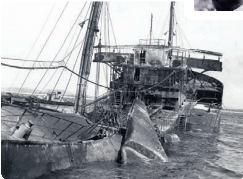
Un barco di azeta torpedita dilanti costa di Corsou.

Cuminsamento di 1942 di berdad mes guera ta yega Antias. Submarinonan Aleman ta realiza atake sorpresa riba e barconan di azeta y refinarianan na Corsou y Aruba. Ta lansa e prome torpedo den e anochi di 15 pa 16 di februari riba un barco di azeta banda di Aruba. E mes anochi ey cuater otro barco ta zink. Un atake riba e refineria di Aruba ta faya. Na april 1942 e Alemannan ta realiza algun atake riba e instalacionnan di azeta na Corsou.