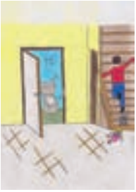
baño y trapi