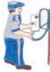
partido di carta