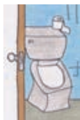
pochi di w.c.