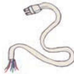
waya di coriente