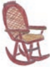
stoel di zoya